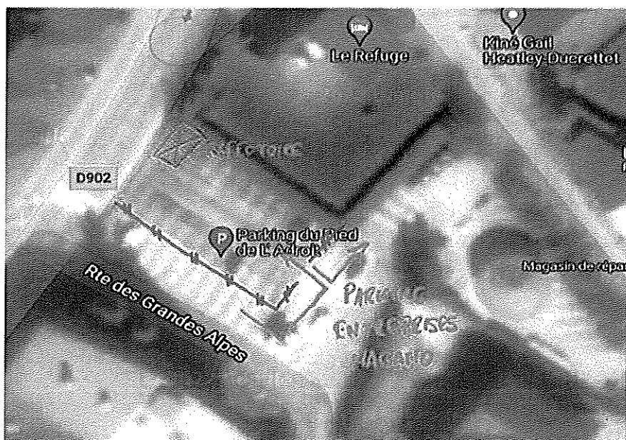
Parking de l'Adroit

Plans de situation du parking de l'Adroit, du chantier et d'évacuation des poids lourds ci-dessous :